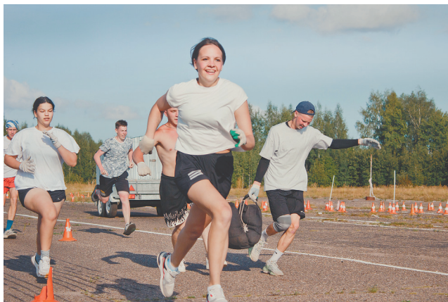
Эстафета: быстро и весело

● Александр Набоков