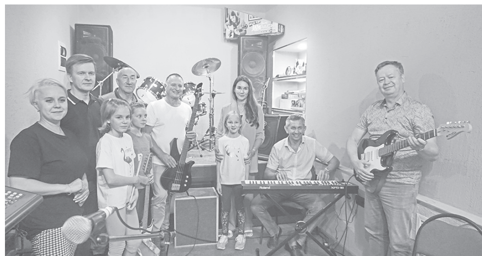
В молодежном пространстве

В завершение небольшого концерта была сделана фотография на память, запечатлевшая юных артистов и гостей, с удовольствием взявших в руки музыкальные инструменты.