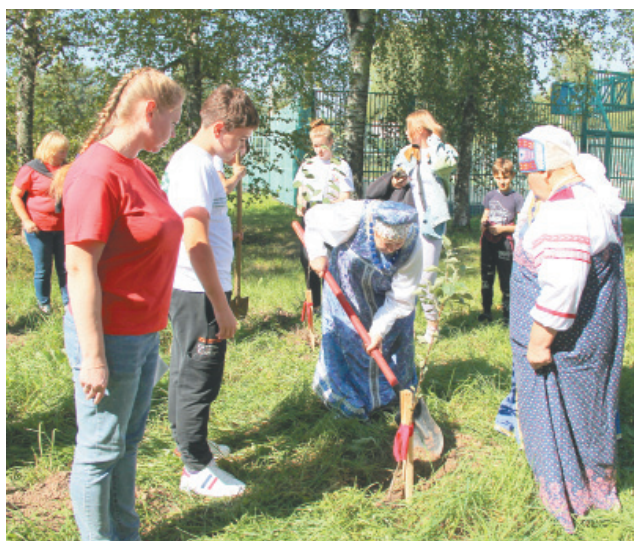
Посадка редких сортов яблонь

попробовали вкусный яблочный пирог, приготовленный стараниями районного центра сохранения культурного наследия и развития туризма. Пирог с чудесным яблочным напитком раздавали представители коллек-