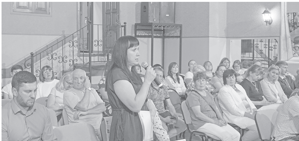
Важно задать вопрос