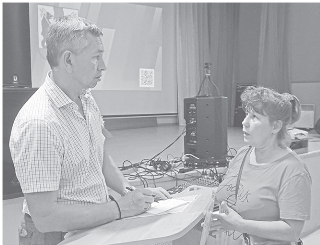
Диалог с главой района