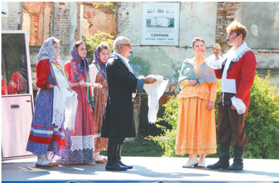
Театрализованное представление на сцене автоклуба